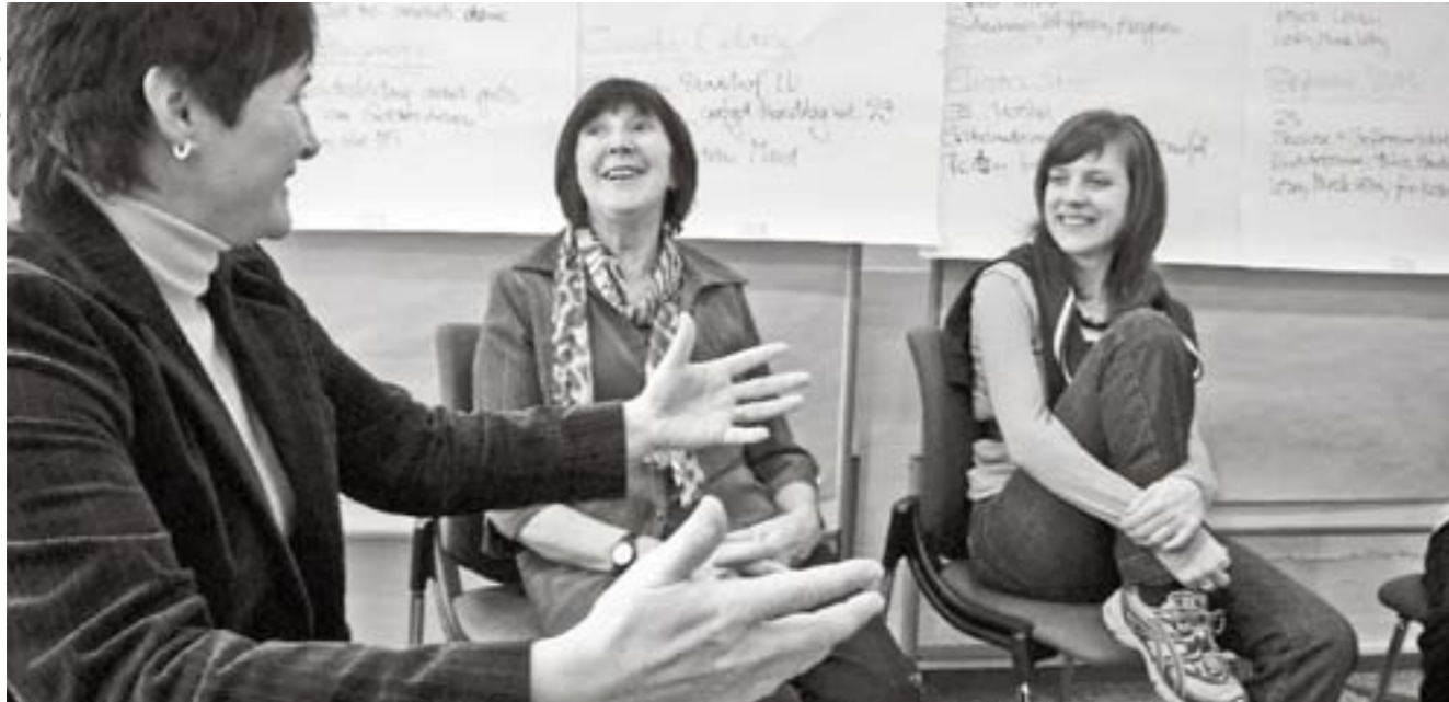
«avanti-donne»-Wochenendkurs: im Zentrum steht der gemeinsame Lernprozess