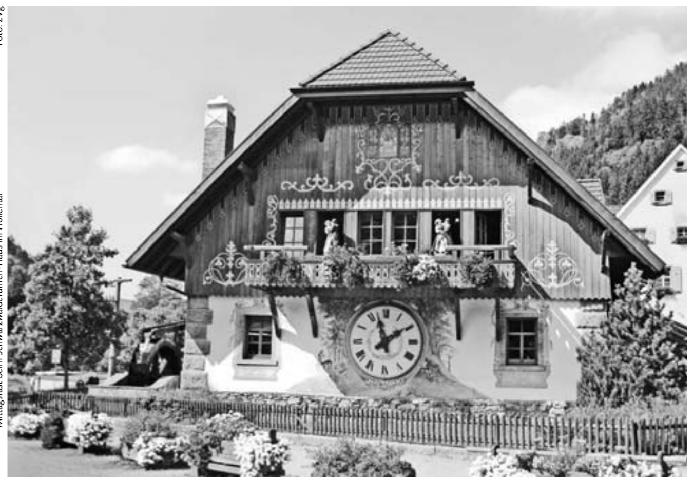
Mittagsrast beim Schwarzwälderuhren-Haus im Höllental