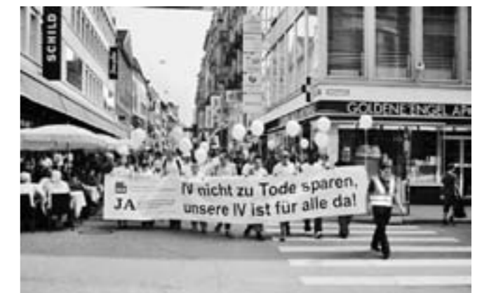
«Ja zur IV-Zusatzfinanzierung» – Kundgebung vom 27. August 2009